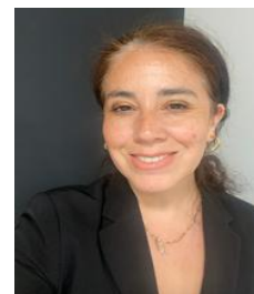
Dra. © Andrea Pinto Vergara Universidad de Santiago de Chile

¡Nos vemos en la 3ª Semana Nacional de la Matemática 2026!